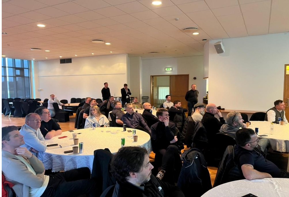
Aðalfundurinn var vel sóttur af aðildarfélögum