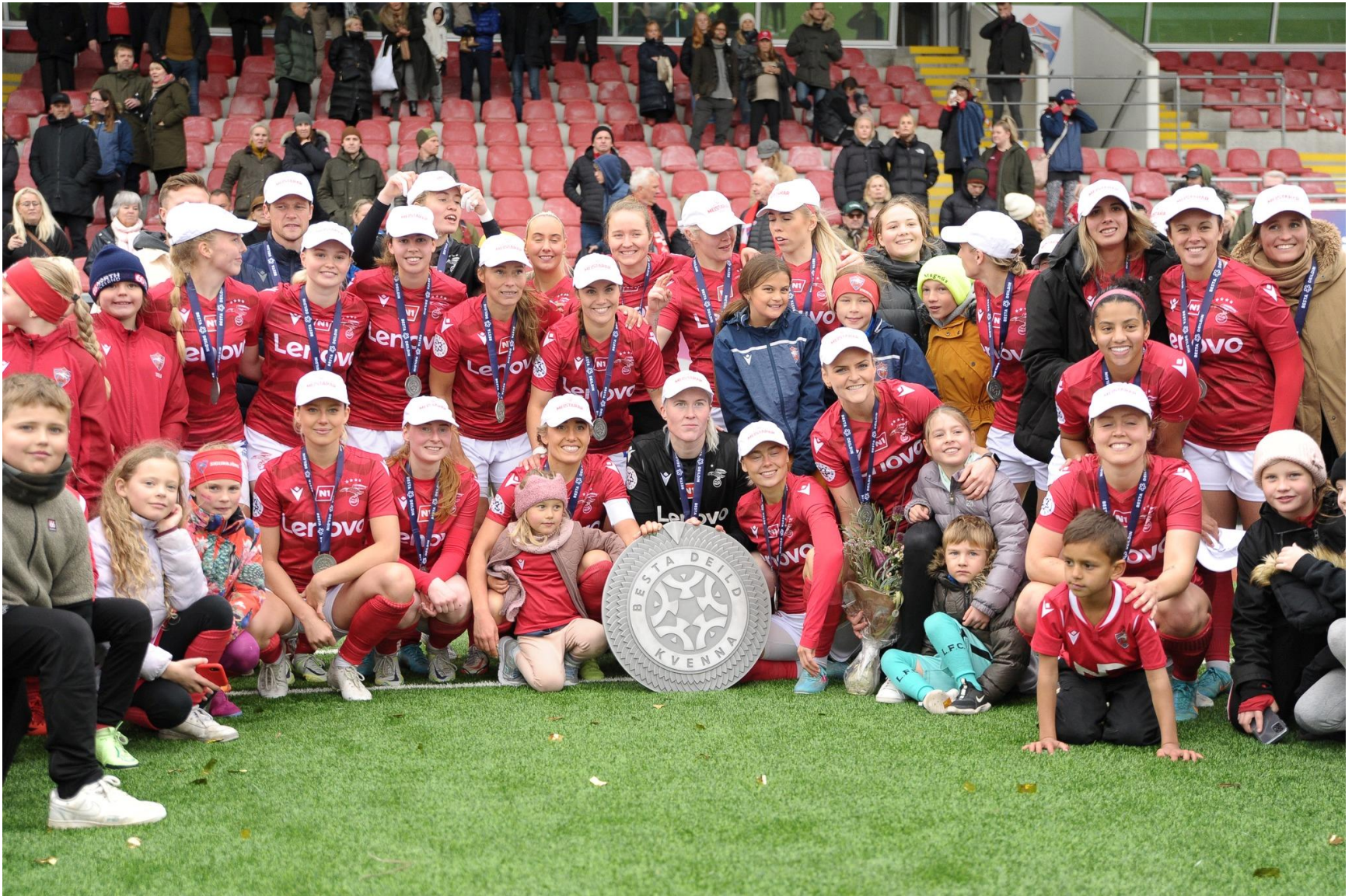
Íslandsmeistarar Vals í kvemnafllokki árið 2022 munu leika með gullmerki á ermi og sama mun karlalið Breiðabliks gera keppnistímabilið 2023.