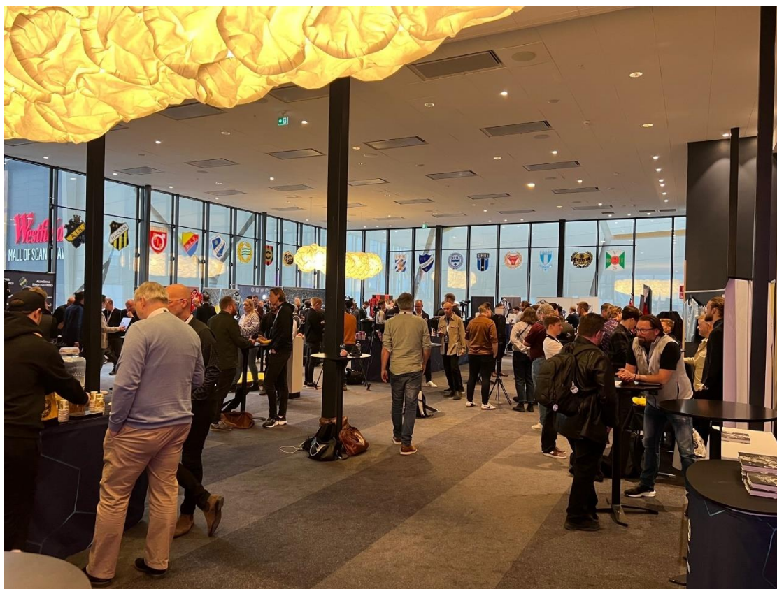
Frá kynningarfundum Allsvenskan