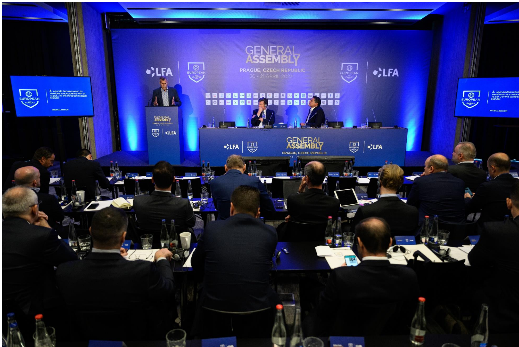
Frá ársþingi European Leagues í Prag