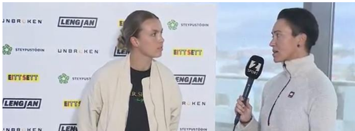
Spá fyrirliða, þjálfara og formanna í Bestu deild kvenna 2023