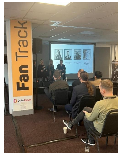
Frá Opta Forum í London

Svokallað Opta Forum sem er ráðstefna skipulögð fyrir starfsmenn félaga, deilda, knattspyrnusambanda og rétthafa var haldin í 10.sinn þann 21.mars s.l. í London. Viðburðurinn er einn af leiðandi alþjóðaviðburðum sem snýr að nýjungum í greiningum í knattspyrnu og eru fjölmörg atriði tekin þar fyrir í fyrirlestraformi og nýjungar kynntar. Gríðarlega mikil þróun á sér stað innan greiningargeira fótboldans og það eru ekki aðeins þjálfarar og starfsmenn félaga sem nýta sér þessar nýjungar heldur eru í auknum mæli rétthafar, sjónvarps, útvarps og stafrænir útgefendur að nýta nýja tækni til að greina betur leikinn og bæta umfjöllun sína um deildarkeppnir um allan heim. Það er gríðarlega mikilvægt að við fylgjumst með þessari þróun og var fulltrúi ÍTF á ráðstefnunni.