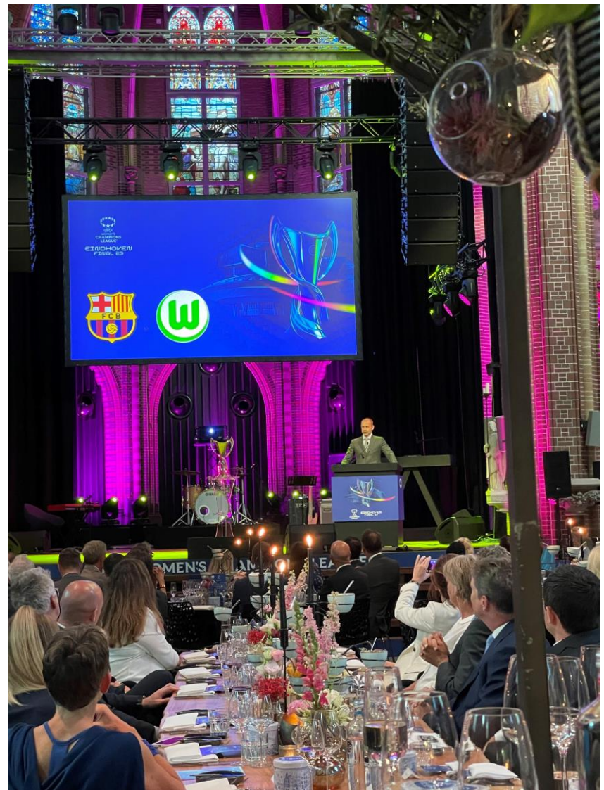
Forseti UEFA, Aleksander Ceferin fyrir úrslitaleikinn

Í skýrslunni kemur m.a. fram að áhugi hefur aukist verulega á knattspyrnu kvenna að undanförunu, hvert áhorfsmetið slegið af öðru og mjög mikir möguleikar felast í auknum sjónvarpstekjum og öðrum réttindatekjum á næstu árum. Enn sem komið er eru þó aðeins tvær deildir í Evrópu sem sýna alla leiki í beinni útsendingu í sjónvarpi, þ.e. Besta deild kvenna á Íslandi og Toppserien í Noregi. Því miður eru all margar deildir enn sem sýna örfáa leiki í beinni útsendingu, jafnvel ekki einn leik í umferð á heilu keppnistímabili að jafnaði en með auknum áhuga mun þeim fjölga á næstunni.