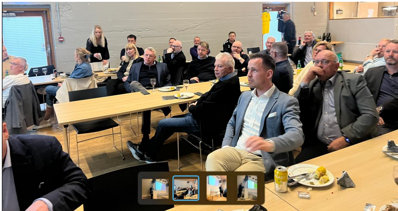
Vel sótt samkoma af Baklandsfélögum Fjölнис