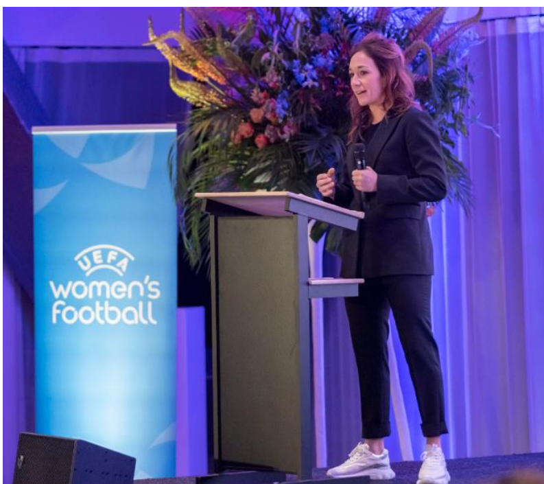
Nadine Kessler, fyrrverandi leikmaður Wolfsburg og leikmaður ársins 2014 er yfirmaður knattspyrnu kvenna hjá UEFA